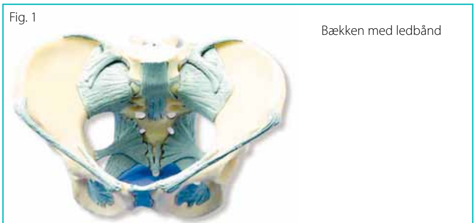
Bækken med ledbånd